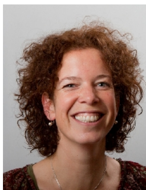
directeur Delftse Daltonschool